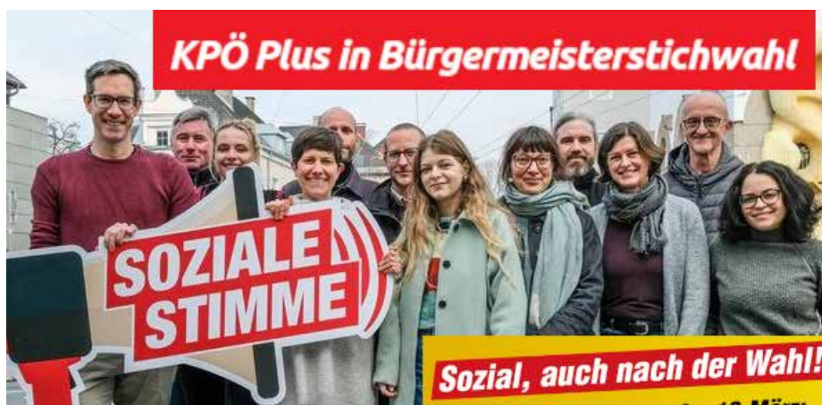
مرشحو الحزب الشيوعي النمساوي

ويهدد النتيجة فقزت قائمة «الحزب الشيوعي النمساوي +» من مقعد واحد في المجلس البلدي عام ٢٠١٩، إلى القوة الثانية في المجلس وبعشرة مقاعد. بالمقابل شغل الحزب الديمقراطي الاجتماعي النمساوي الموقع الأول بحصوله على أحد عشر مقعداً. وحل ثالثاً حزب الشعب النمساوي اليميني المحافظ بحصوله على ثمانية مقاعد، وجاء رابعاً حزب الحرية اليميني المتطرف بأربعة مقاعد. في حكومة المدينة، التي يشترك فيها جميع الأحزاب