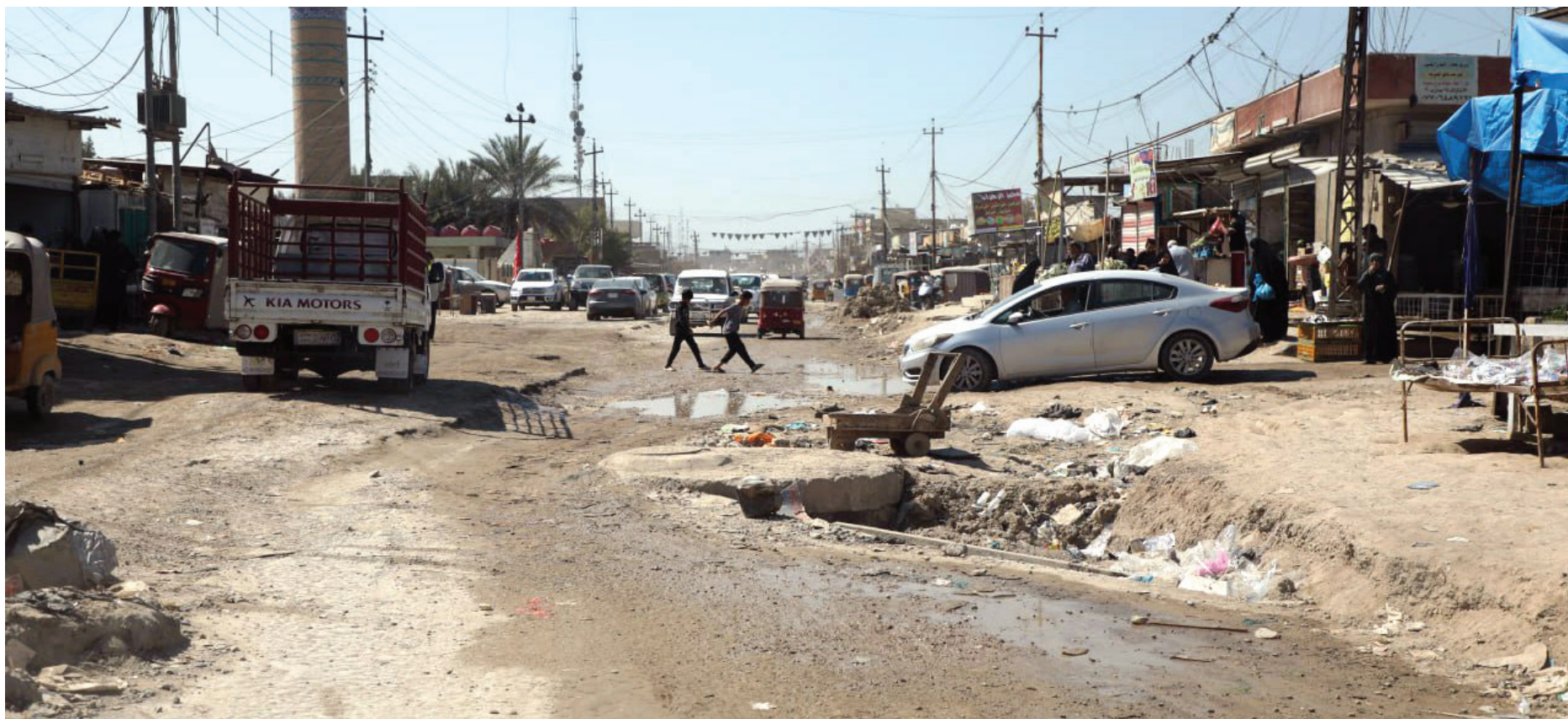
اهالي سبع قصور في بغداد يشكون من الاهمال وانعدام الخدمات

أخذت تداعيات قرارات المحكمة الاتحادية العليا بشأن مقاعد «الكوتا» في برلمان كردستان، وتوطين رواتب الاقليم، تلقي بظلالها على العلاقة الهشة بين بغداد وأربيل، وعلى معيشة الموظفين والمشهد السياسي في كردستان. بعد أن أطلقت وزارة المالية رواتب موظفي الإقليم لشهر شباط الماضي، صرحت الوزيرة طيف سامي، يوم أمس، أنها لن تسمح بإطلاق تمويل تلك الرواتب لشهر آذار إلا بعد التوطين، مشيرة الى أنها تحرص على تطبيق قرار المحكمة الاتحادية.