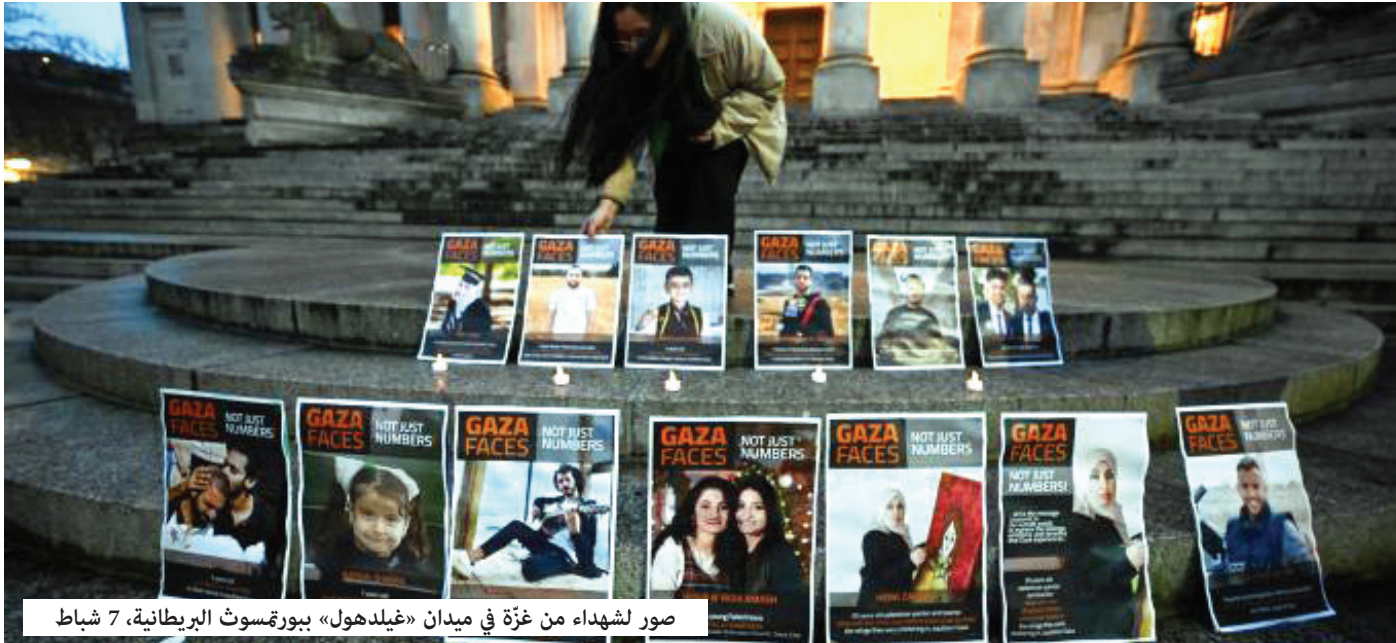
صور لشهداء من غزة في ميدان «غيلدهول» ببروكسل البريطانية، 7 شباط

أكثر عدالة. عند هذا الحد لا تتوقع النسوية العربية على ذاتها بقدر ما تفتتح على أشكال مختلفة من العمل النسوي حول العالم».