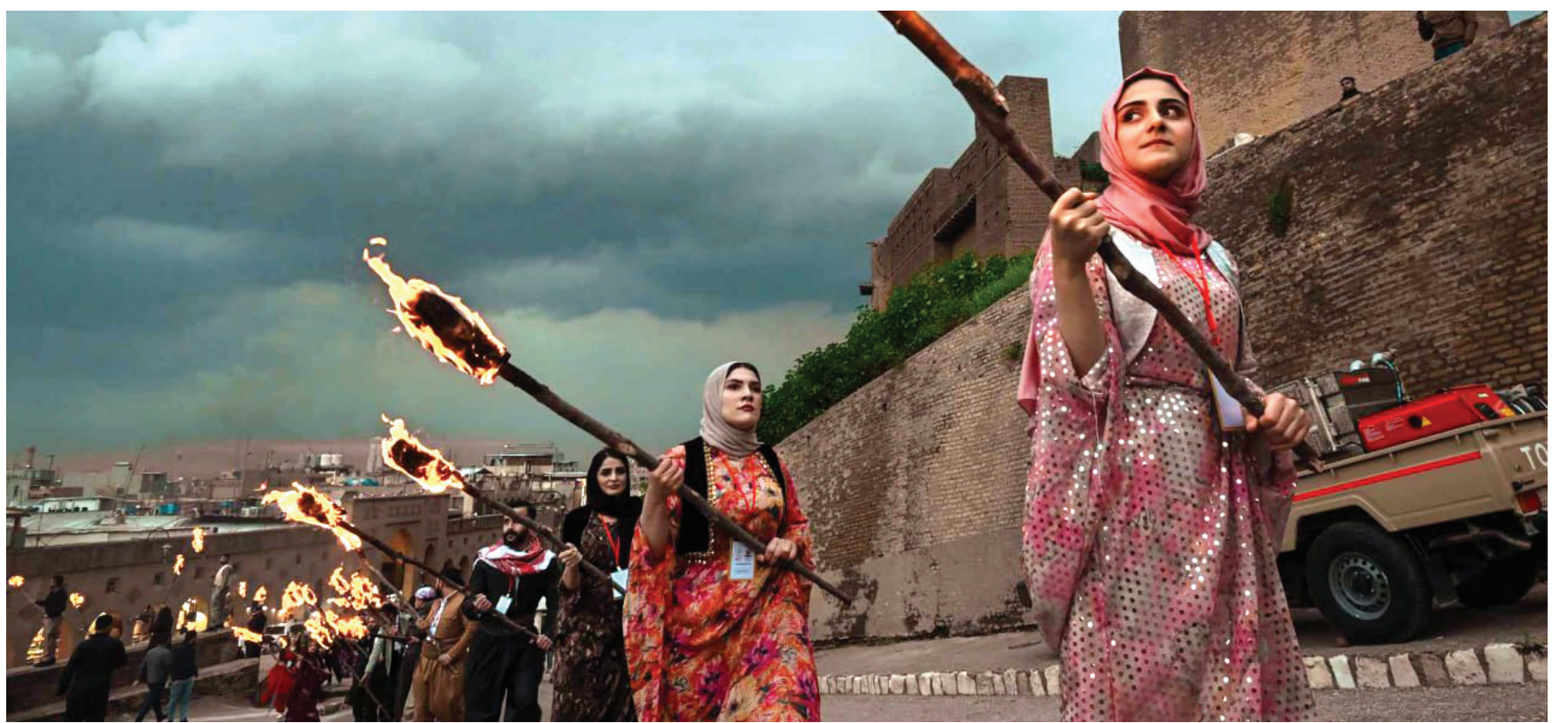
شابات وشبان يستعدون لإيقاد شعلة نورووز قرب قلعة اربيل التاريخية

وأضاف انه «إذا نظرنا إلى تاريخ الحركات والتطورات الاجتماعية التي سبقتها، نلاحظ أن ما يُسمى بالمكاسب الاجتماعية، مثل الضمان الاجتماعي والصحي وغيرها، تُعتبر مكاسب اجتماعية فُرضت على رأس المال وانثزعت منه، بمعنى أخذ حصة من الربح، اما في بلداننا فتأخذ حصة من الربح». وأشار إلى انه «في ظل الصراع الاقتصادي الذي تخوضه النقابات من أجل حقوق العمال وتحديد الأجور وتحسين ظروف العمل، يبرز صراع آخر يتعلق بمسار التطور الاقتصادي»، منوها إلى ان «الصراع له صلة