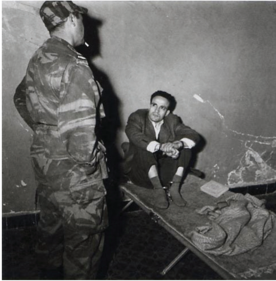
العربي بن مهدي

جاء فيلم «العربي بن مهدي» في وقت تحتاج الجزائر كي تقفز إلى الأمام أن تتأمل ماضيها التاريخي الناصح والإنساني الشجاع، أن يلتفت الجزائري اليوم إلى أن تحقيق الاستقلال ليس مسألة بسيطة، وأن بناء الدولة المعاصرة الحديثة ليس أقلّ جهداً وتضحية من بناء الاستقلال، وأن لا استقلال من دون دولة وطنية قوية سياسياً واقتصادياً