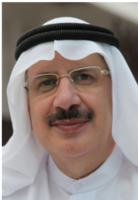
صحيفة «الخليج» - 11 شباط 2024

عسلٍ وصاحب كما يقال، تركوا لنا روائع الكتب وكنوز الحكمة والمعرفة.