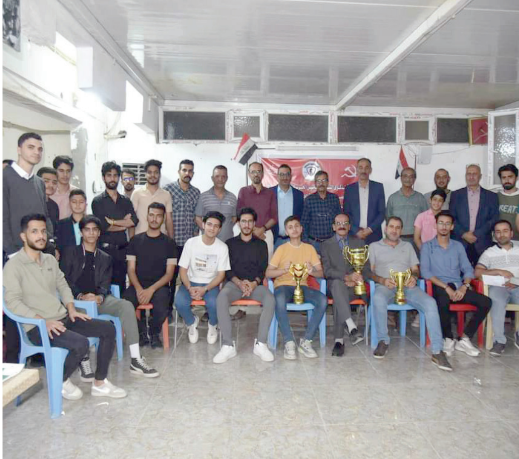
جانب من بطولة الشطرنج التي نظمتها محلية الديوانية للحزب الشيوعي العراقي لمناسبة ذكرى التأسيس

الوسط الثقافي يعاني من عدم الاهتمام بالثقافة والمنتقنين