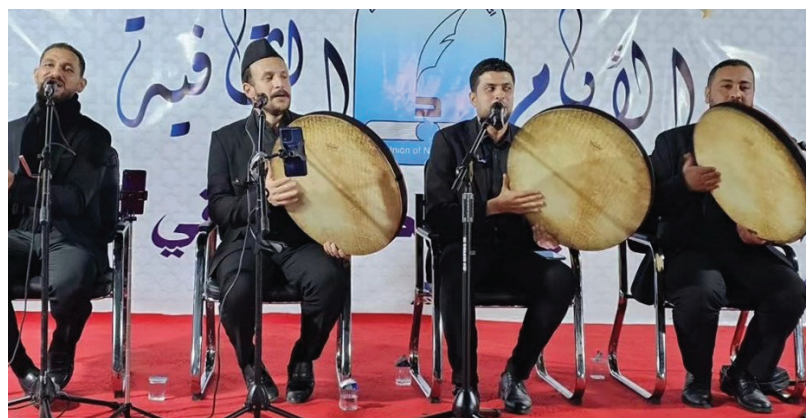
فرقة "جذور موصلية" تؤدي مدائح نبوية ضمن فعاليات اليوم الأول