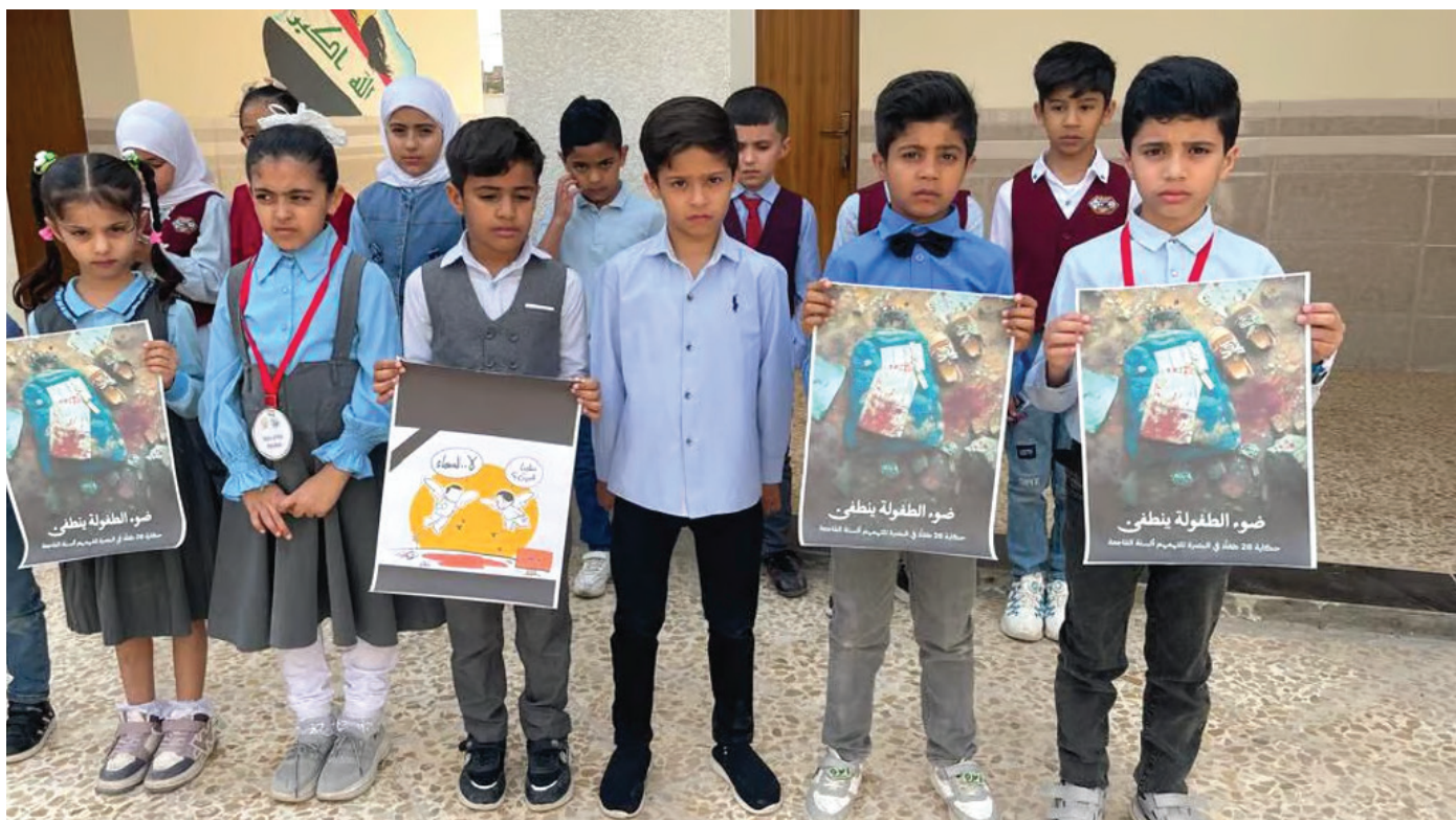
تلاميذ مدارس البصرة في وقفة حداد على ارواح ضحايا حادث الدهس المرور