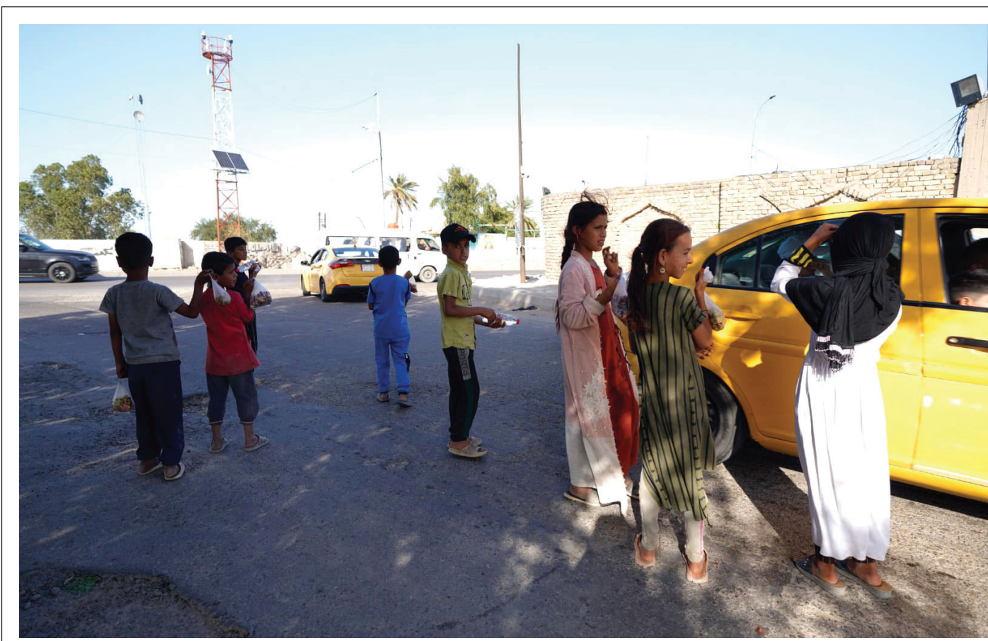
في أيام العيد.. اطفال يحاولون تدبير قوت أهاليهم بدل الذهاب إلى «المراجيح»

ان اعلان التوجهات امر مفيد ومهم، لكن العبرة لا تكمن في حسن النوايا على أهميتها، وانما في ان ترى تلك التوجهات النور وتتحول إلى واقع ملموس ومعاش، وان تكون في خدمة المواطنين جميعاً من دون تمييز.