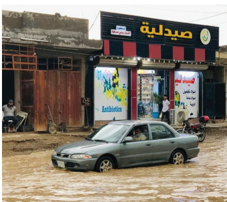
هكذا أصبحت شوارع الطارمية خلال موجة الأمطار الأخيرة

وفي حديث صحفي، يقول عدد من الأهالي أن "الطارمية تعد من المناطق المنكوبة خدمياً"، مبينين أن مشروع مجاري المنطقة متوقف منذ 12 عاماً، وشوارعهم لا تزال ترابية.