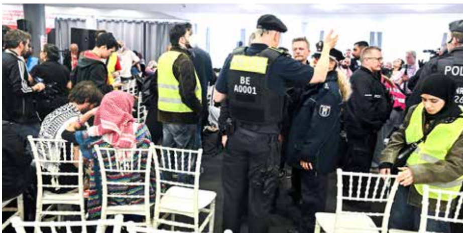
الشرطة الألمانية تقتحم قاعة المؤتمر

في يومي ٨ - ٩ نيسان بدأت محكمة العدل الدولية في مدينة لاهاي الهولندية جلسات استماع الدعوة التي أقامتها نيكاراغوا ضد ألمانيا، بتهمة المساعدة في حرب الإبادة الجماعية التي تشنها إسرائيل ضد سكان غزة. ومن المتوقع أن تستمر المرافعات في الدعوة سنوات، لهذا طلبت نيكاراغوا من المحكمة، بسبب الوضع الكارثي في قطاع غزة، إصدار أوامر مؤقتة. ومن المتوقع صدور قرار المحكمة في غضون عشرة أيام تقريبا. وعلى النقيض من الدعوى التي رفعتها جنوب أفريقيا ضد إسرائيل بشأن ممارسة الإبادة الجماعية، تشير نيكاراغوا أيضًا، إلى عدم التزام ألمانيا باتفاقيات جنيف لعام ١٩٤٩ وبروتوكولاتها الإضافية. وتتهم نيكاراغوا ألمانيا بعدم مراعاة القواعد الملزمة في القانون الدولي و«تقديم المساعدة أو الوقوف إلى جانب الحفاظ على نظام الفصل العنصري الإسرائيلي غير القانوني» وبالتالي حرمان الشعب الفلسطيني من حقه في تقرير المصير.