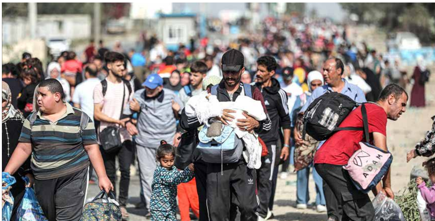
جيش الاحتلال يستهدف سكان قطاع غزة الذين يحاولون العودة إلى ديارهم

بدورها، دافعت حركة حماس عن رد إيران، وقالت في بيان «تعتبر العملية العسكرية التي قامت بها الجمهورية الإسلامية في إيران ضد الكيان الصهيوني المحتل حقا