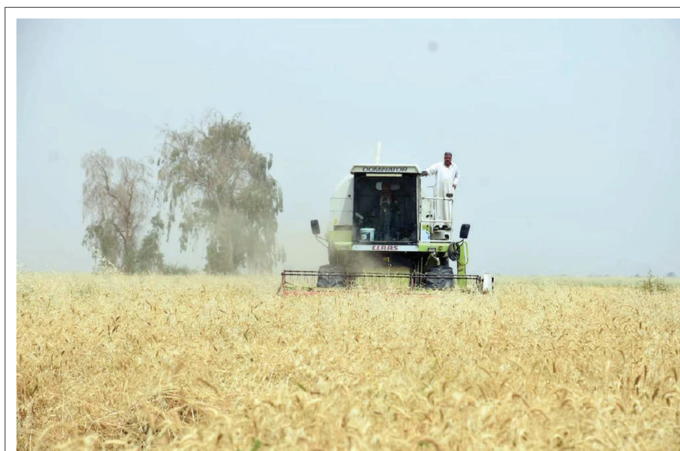
انطلاق موسم حصاد الحنطة في العراق

ألف تحية لشهداء الحركة الفلاحية ألف تحية للاتحاد العام للجمعيات الفلاحية في ذكره الخامسة والستين.