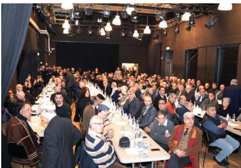
في مجلس عزاء الفقيد

وعبر المتحدثون جميعاً عن خصال الراحل الفنية المتميزة والانسانية المحبوبة، مستذكّرين إياه بكثير من المواقف في داخل العراق وخارجه.