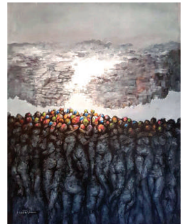
أحد أعمال المعرض للفنان سامان أبو بكر