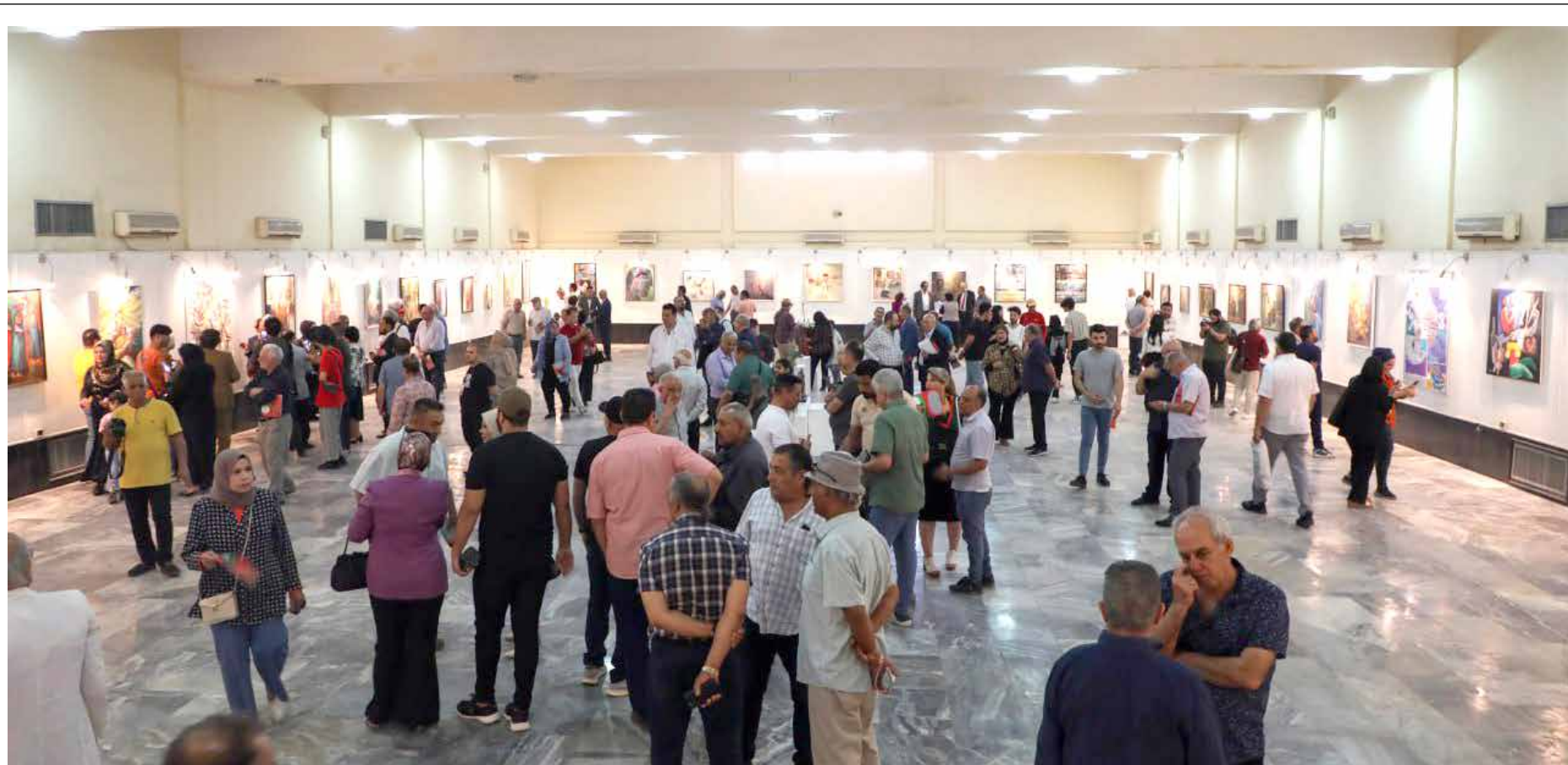
في المعرض السنوي للفنون التشكيلية العراقية، الذي افتتح أمس الاول الاحد، ضمن احتفالات الذكرى التسعين لتأسيس الحزب الشيوعي العراقي &lt;&lt; 7

وبسبب هذه الحراك الاجتماعي وارتفاع مستوى