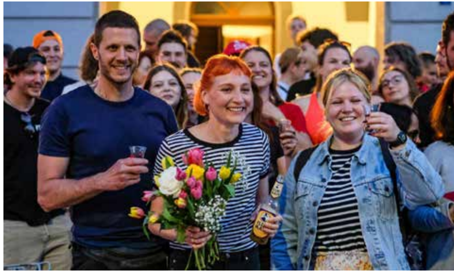
مرشحو الحزب الشيوعي النمساوي لمجلس المدينة

عقود، فهل ستأتي النتائج مطابقة لهذه الاستطلاعات؟