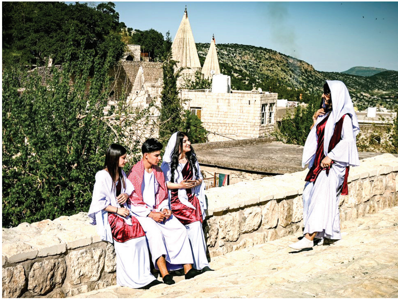
اليزيديون احتفلوا أمس الاول برأس السنة اليزيدية في معبد لالش بقضاء الشيخان