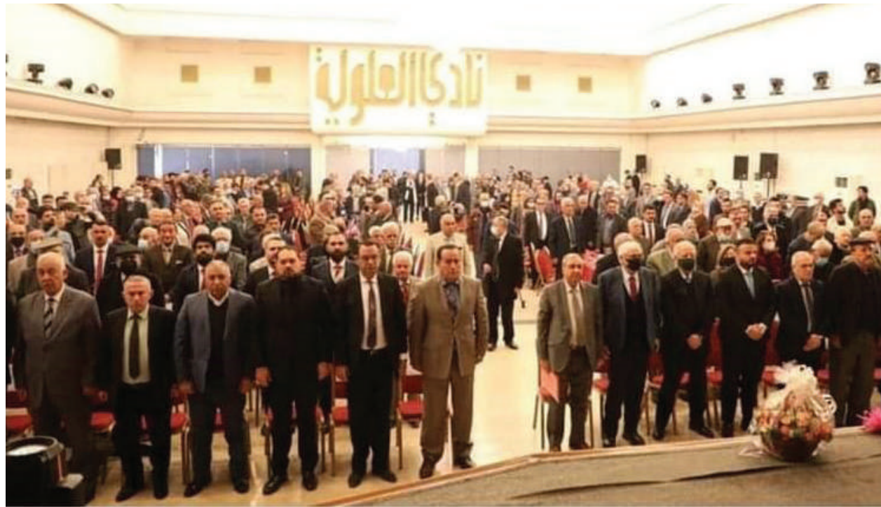
المؤتمر الثالث للتيار الديمقراطي العراقي عام 2022

توسيع حضوره ونشاطه بين الجماهير، ويعمل على تقوية أواصر العلاقة والتنسيق مع بقية الأحزاب والشخصيات المؤمنة بالدولة المدنية الديمقراطية والعدالة الاجتماعية، كونها الحل الوحيد لمشاكل العراق والمخرج الآمن له من أزمات المحاصصة والفساد والصراع الدائر على السلطة والنفوذ".