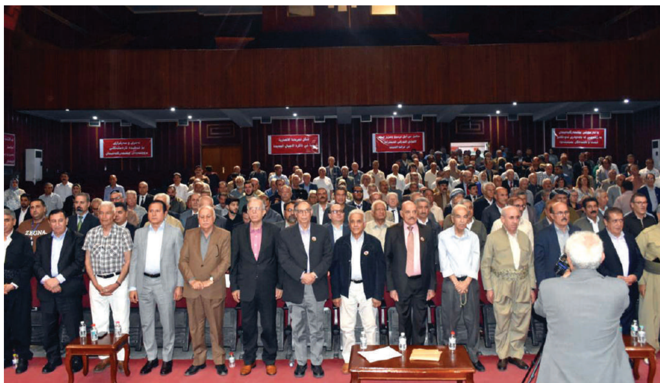
المؤتمر الحادي عشر لرابطة الانصار الشيوعيين العراقيين افتتح اعماله امس السبت في اربيل

الوحدة والسيادة الوطنية، والتماهي مع التداخلات الخارجية، في محاولة بائسة لتأييد بقائها في السلطة التي تتعامل معها كخنيمة يجب تقاسمها بين أطرافها المنتفذة.