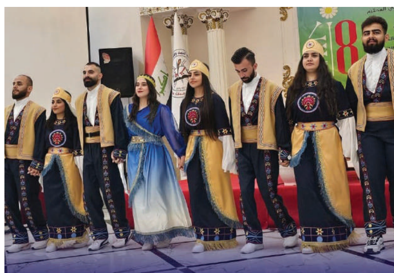
من لوحة رقص تراثية قُدمت في افتتاح المهرجان