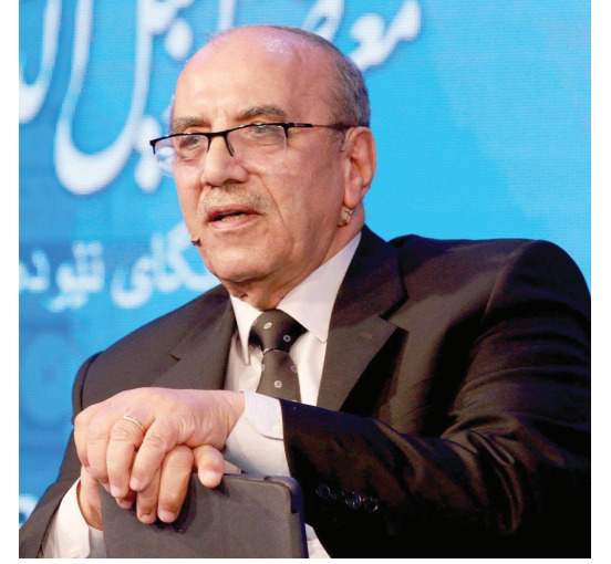
القاضي هادي عزيز علي

وحسب توصيف المحاصصة والبناء المؤسسي لها وكأثر من آثارها، فانها تؤدي حتما الى انتهاك القواعد القانونية العقابية. وبغية تعقب هذه الانتهاكات فلا بد من وجود مشتكي ومشتكى عليه (مدعي ومدعى عليه)، وهنا يأتي الدور الريادي للمحاصصة المتمثل في تعزيز موضوع حل الخلافات بين ممثلي الهويات الجزئية بعيدا عن انظمة العدالة، اذ تتمكن المحاصصة من تخييب الدعوى او حتى التفكير فيها، لكون هذا التفكير او حضورها يحرم طرفي المحاصصة من مكتسباتها