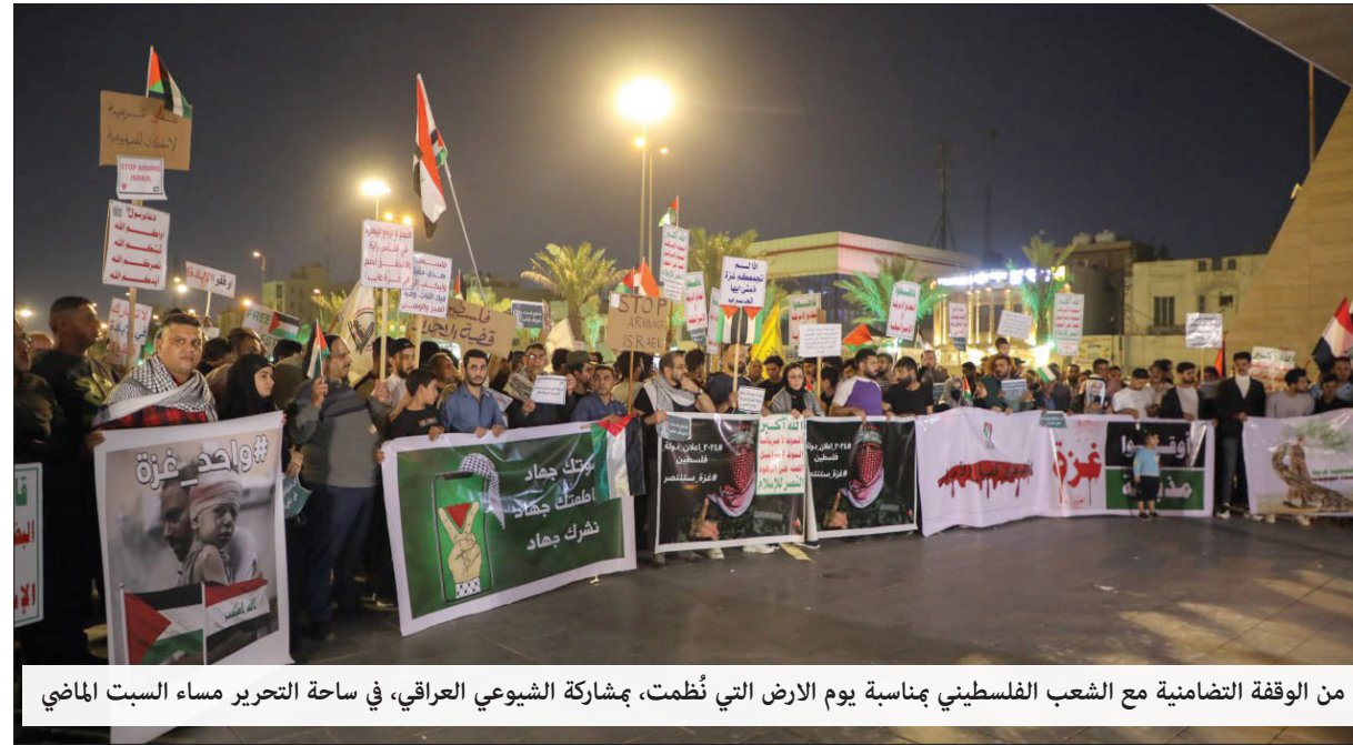
من الوقفة التضامنية مع الشعب الفلسطيني بمناسبة يوم الأرض التي نظمت، بمشاركة الشيوعي العراقي، في ساحة التحرير مساء السبت الماضي

محبتنا نهديك إياها بـ 90 وردة جوري مرددين : كل سنة من سنين عمرك ورد جوري وباسمين يا طريق الشعب أنت ،، ويا هوية أكبر أكبر ،،، وبعد تكبر ،،، وننتظر عيدك الميَّة لأنك كل عام تزداد أنفاً وتتشع نضالاً من أجل الوطن والناس.