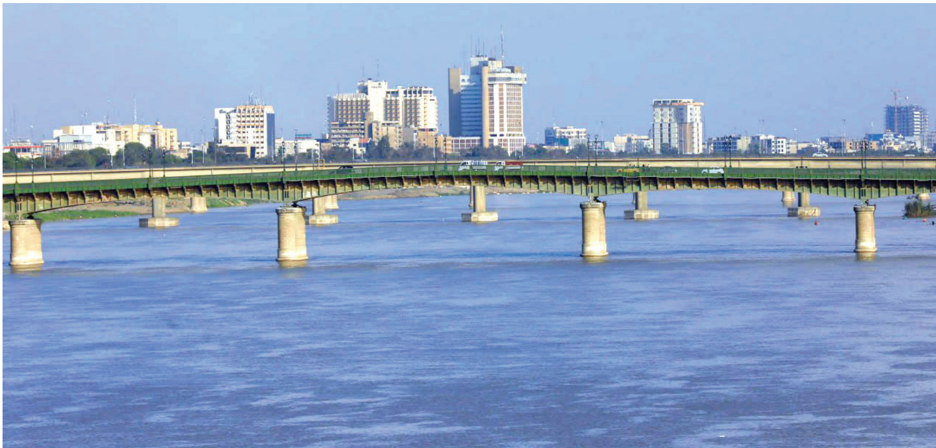
نهر دجلة ينتعش بمياه الامطار على امل تجاوز أزمة الجفاف