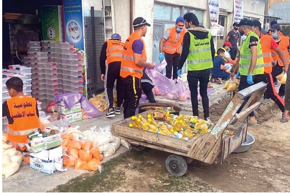
استطاعت حملات التكافل الاجتماعي إغاثة أعداد كبيرة من الفقراء والنازحين

فبالرغم من النوايا الحسنة والغرض النبيل من هذه الجهود الإنسانية، إلا أن الشكوك بدأت تتوهم حول قسم منها، بسبب تصرفات بعض الأشخاص المشبوهين الذين يستغلون الظروف الصعبة في تحقيق مكاسب شخصية.