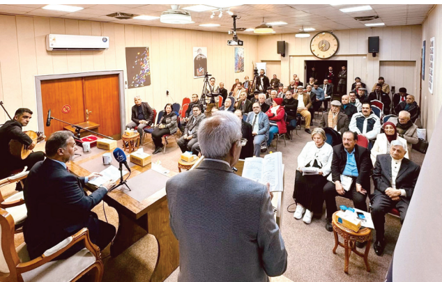
الفاصلة التي يكون فيها القلب معلقاً