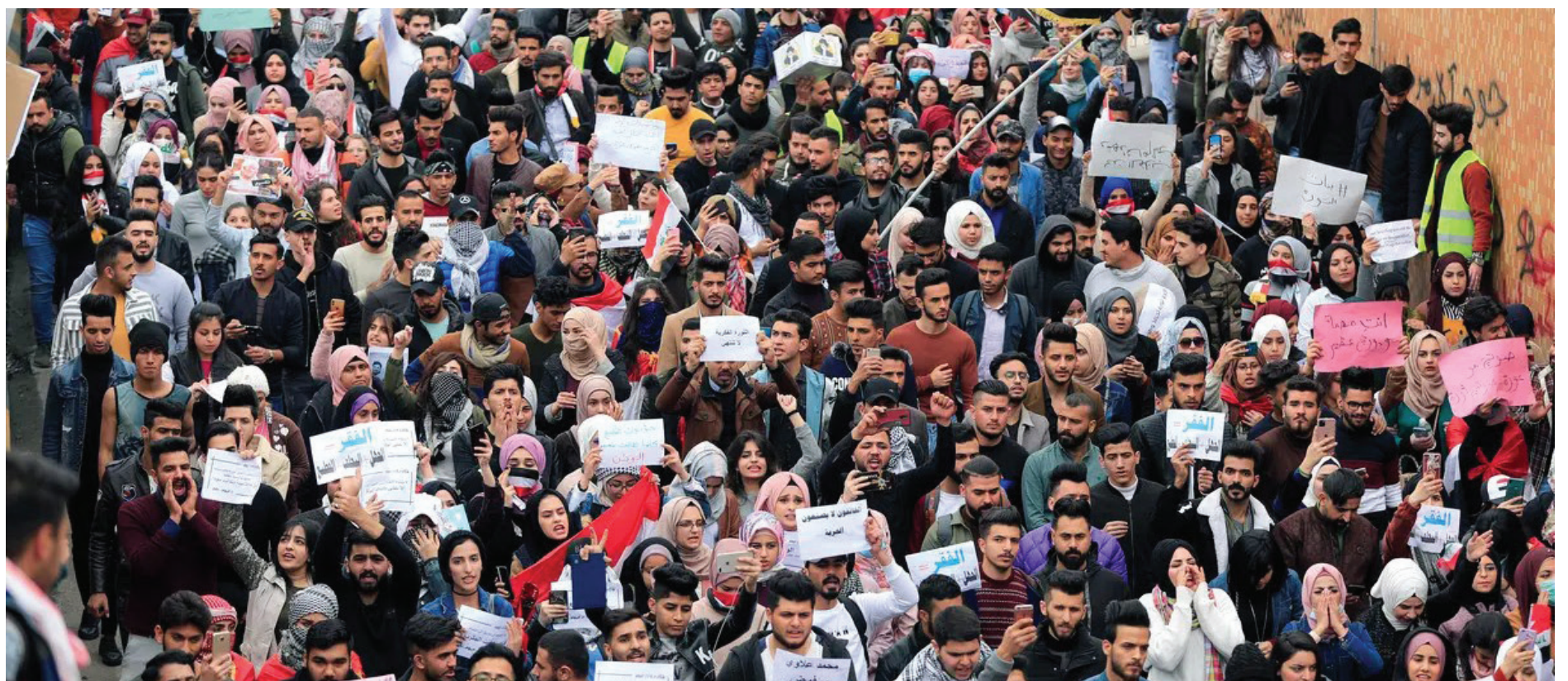
مدونون يستذكرون انتفاضة تشرين ٢٠١٩ بفخر: مظاهر التحرش غابت عن ميادين الاحتجاج « 3

مختلفتين، لا ضمن منظومة تنفيذية واحدة، يفترض أنها مسؤولة أمام المواطن. ان الإخفاق الواضح في تنويع مصادر الطاقة، والتكاسل في البحث عن بدائل مستدامة، وعدم استثمار الغاز الوطني الذي لا يزال يُحرق عبثاً في الحقول النفطية، فضلاً عن تجاهل استثمار الغاز الحر، هذا كله يشكل واقعا مفاده ان المستفيدين من المحاصصة وتقاسم عوائد الأموال لهم رأي آخر.. لهم رغبة دائمة في بقاء "الحل" مرهوناً بموئيد وكاز.