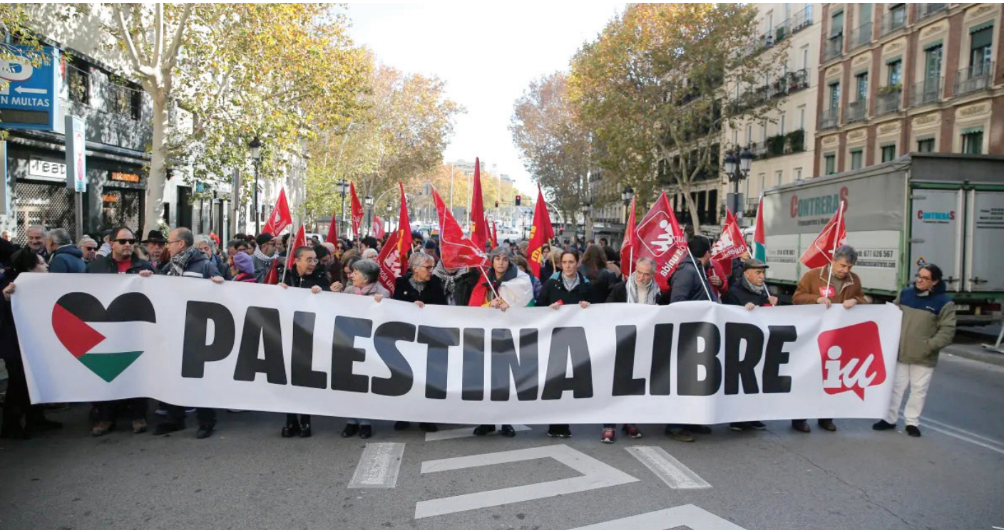
جانب من احتجاجات التضامن مع الشعب الفلسطيني في أوروبا

ووجهت اللجنة المركزية للحزب تحايا إلى عدد من الأحزاب الشقيقة والصديقة، بمناسبة تأسيسها أو عقد مؤتمراتها الوطنية.