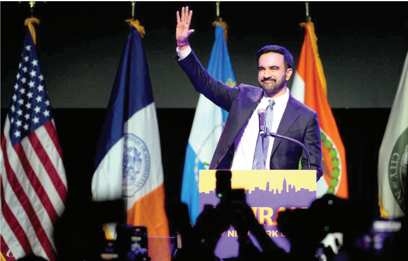
فوز زهران ممداني بمنصب عمدة نيويورك أحد أهم نجاحات اليسار خلال العام الماضي

ودعنا عاما، يعد امتدادا لسابقه، من حيث تأكيد اتجاهات الصراع بين القوى المهيمنة، وبينها وبين قوى اليسار والتقدم والشعوب المناضلة من أجل حريتها وسعادة شعوبها. لقد أكد الخط البياني استمراره لصالح قوى اليمين المتطرف في أوروبا وأمريكا اللاتينية، التي شهدت، خلال العام، عودة اليمين إلى السلطة في بوليفيا وتشيلي والهندوراس. لقد مثل توني دونالد ترامب، في بداية العام، مهام منصبه زخما لهذه القوى وكشفت مجريات حملات الانتخابات في العديد من البلدان عن تدخل متعدد الاشكال لإدارة ترامب، والمحيطين بها لصالح قوى اليمين المتطرف، حتى في بلد حليف مثل ألمانيا.