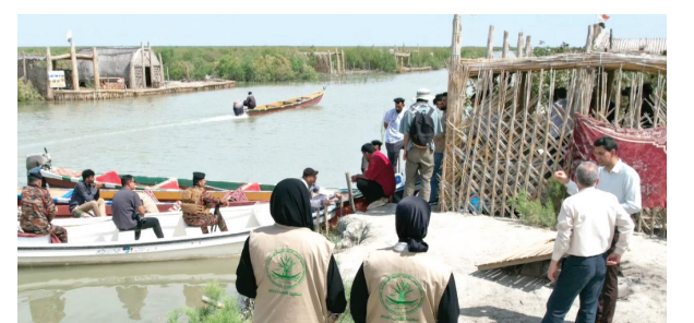
متابعة - طريق الشعب

تزامناً مع توافد أعداد كبيرة من السائحين إلى أهوار الجبايش، بعد ارتفاع مناسيب المياه فيها، أطلقت مديرية بيئة ذي ومنظمات مدنية، أول أمس الجمعة، حملة توعية تدعو إلى الحفاظ على المياه والحد من تلوثها.