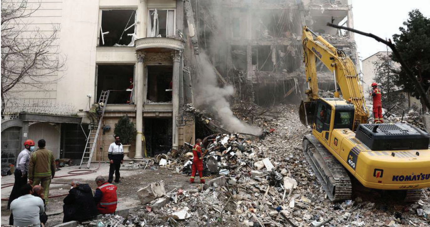
طهران - وكالات

تجه الأنظار إلى العاصمة الباكستانية إسلام آباد، حيث تشير التطورات إلى إرهاصات جولة محادثات ثانية مرتقبة بين إيران والولايات المتحدة بواسطة باكستانية، وسط تأكيد أمريكي ونفي إيراني.