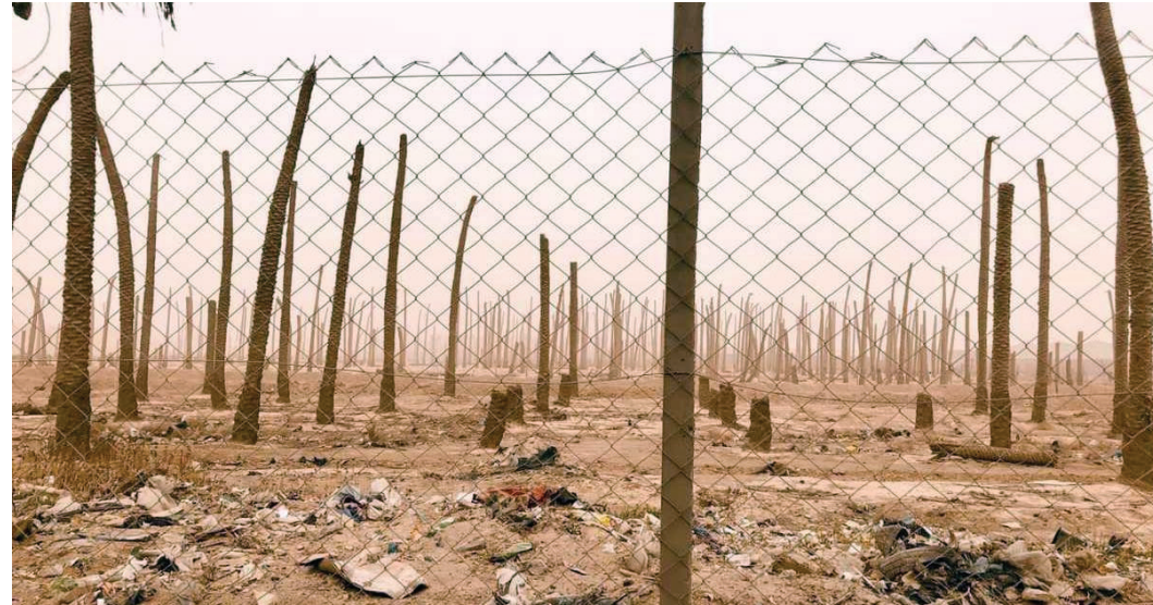
أراضٍ زراعية واسعة لا تزال تُجرّف وتحوّل إلى مشاريع استثمارية ربحية

وسبق أن نظم عشرات الأهالي في قرى محافظة كركوك وقفة احتجاجية ضد مصادرة أراضيهم من قبل جهات مختلفة، قالوا إنها "تستغل مناصب حكومية في سبيل نزع أراضيهم". وقبل نحو شهرين، برزت قضية قرية دوخلة في محافظة ديالى بوصفها نموذجاً حياً لما يصفه الأهالي بـ"خطر الإزالة القسرية".