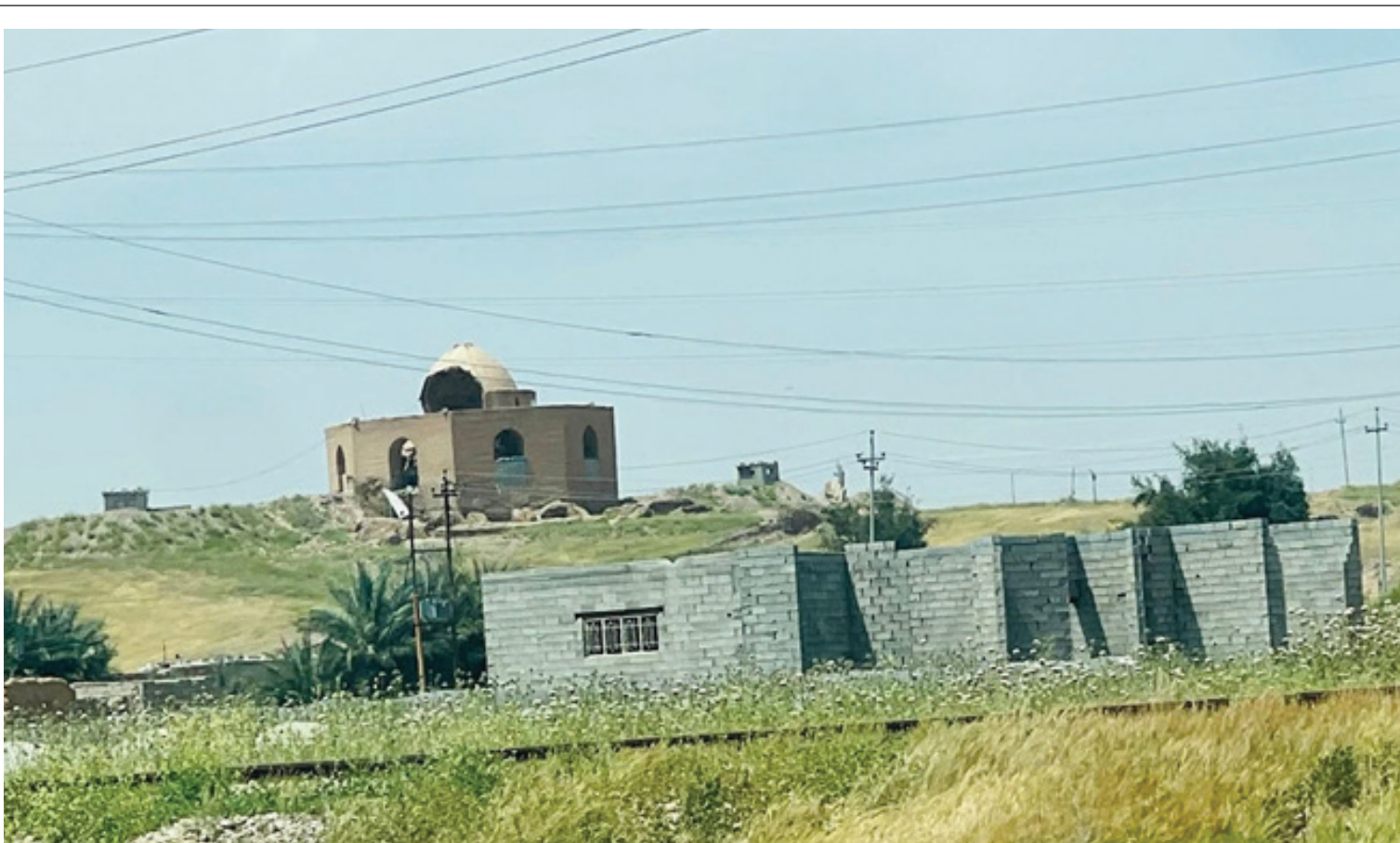
نتيجة الهمال.. سقوط أجزاء من القبة الصليبية في سامراء