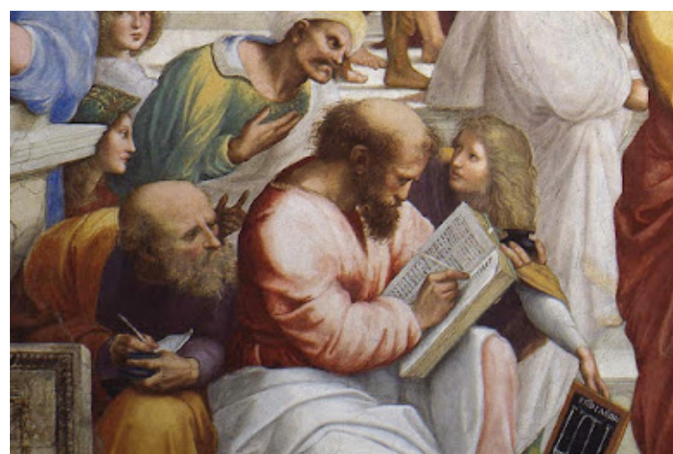
ابن رشد كما صورته رهايل في لوحة مدرسة أئينا

لنقد التراث، باعتباره نقداً مزدوجاً للمعرفة التراثية والنظرة إلى التراث، فالعلمياتان؛ إذ رأى المؤلف مترابطين بل متداخلتين؛ أما البحث العلمي في التراث، فيبدأ من القطع المعرفي مع ثلاث نزعات مؤدية للموضوع شديد الأذى: النزعة التجريبية للتراث، وهي السائدة في أواسط التراثيين، المتمسكين بفرضية جاهزية التراث لتقديم أجوبة لمشكلات العصر، والنزعة الاحتقارية للتراث المتمسكة بفرضية أن المستقبل يبدأ من القطعة مع الماضي، ثم النزعة الاستعمارية للتراث، المتمسكة بفرضية أن التراث جبهة صراع ثقافي أيديولوجي، ومادة للاستغلال لمصلحة هذا الموقع أو ذاك. في ضوء هذه الفرضيات يرسم بلقرين خريطة معرفية للمناهج المستخدمة في دراسة التراث الثقافي في الفكر العربي